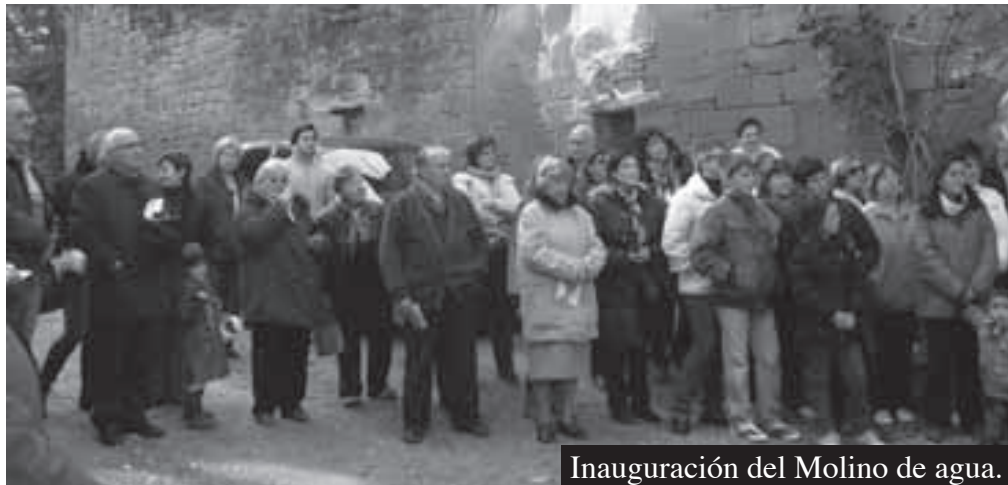
Inauguración del Molino de agua.

– Los locales de la Banda Municipal en el edificio de la casa consistorial, en la plaza mayor, ha quedado pequeño para los ensayos de los numerosos miembros de la Banda; además allí también ensayan la Coral Municipal y el Grupo de cuerdas.