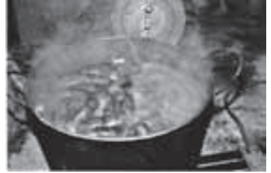
Morcillas, cociendo en el caldero

Los cerdos en casa se crían en siete u ocho meses y las granjas en tres o cuatro los engordan. Hay una gran diferencia de sabor entre los criados en un sitio u otro, como de la clase de alimentación que se da al animal. Del cerdo se aprovecha todo y todo es riquísimo. En Luna tenemos la suerte de que prácticamente todo el año comemos buenas bolas, morcillas, chorizo y longaniza elaborado en la carnicería del pueblo y hace tres años que también en Erla elaboran buenos embutidos para la venta.