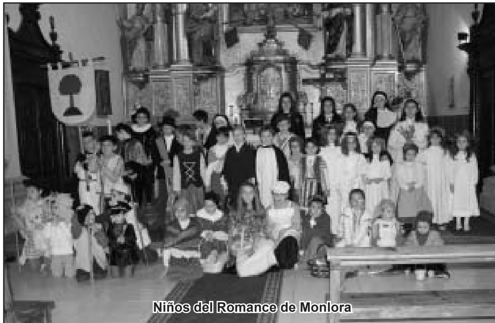
Niños del Romance de Monlora