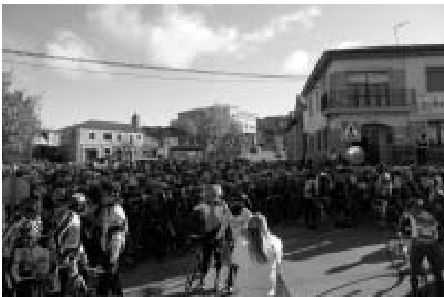
Foto 1: los participantes antes de tomar la salida en la Plaza de España de Luna

Los participantes procedían de Aragón, Navarra, La Rioja, Cataluña, Madrid y País Vasco.