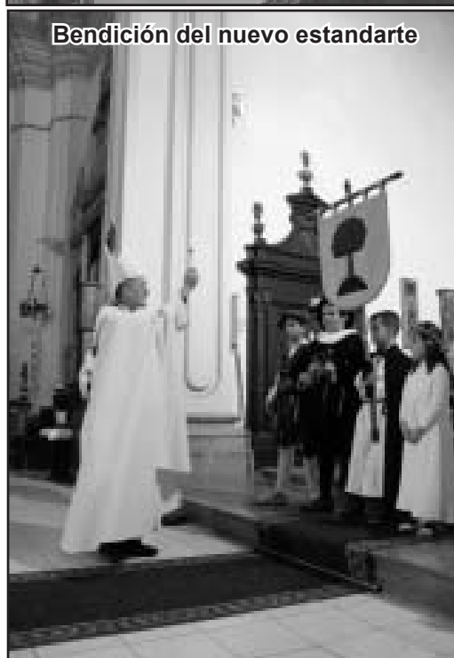
Bendición del nuevo estandarte