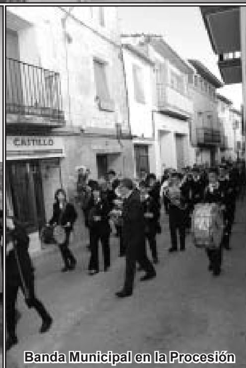
Banda Municipal en la Procesión