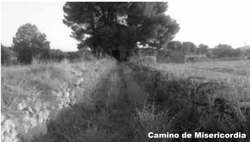
Camino de Misericordia

* Escuela. El CRA (Colegio Rural Agrupado) Monlora inició el nuevo curso escolar con una reducción de alumnos y un profesor en Luna. El colegio se compone de: un aula en Piedratajada con 6 alumnos, dos aulas en Erla con 11 alumnos y dos aulas en Luna con 23 alumnos; el claustro es de 8 profesores.