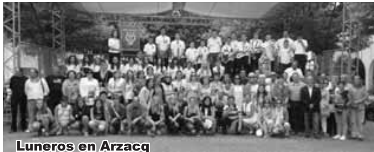
Luneros en Arzacq

(Francia). Este año se conmemora el 10º Aniversario del hermanamiento entre las localidades de Luna y Arzacq y ambas debían firmar el documento