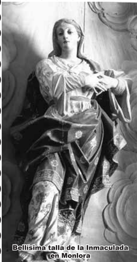
Bellísima talla de la Inmaculada en Monlora