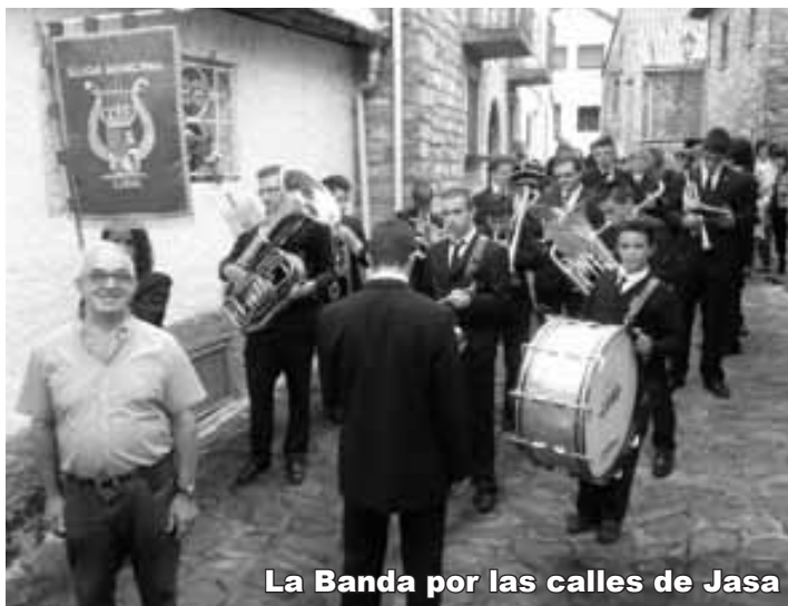
La Banda por las calles de Jasa

La actuación de la Banda de Música de Luna tuvo lugar el día 20 y, aunque recogió un numeroso aplauso y varias felicitaciones, no logró clasificarse para la final.