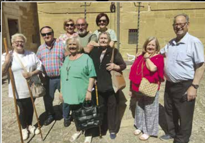
19 de junio: grupo de vecinos de Lacorvilla