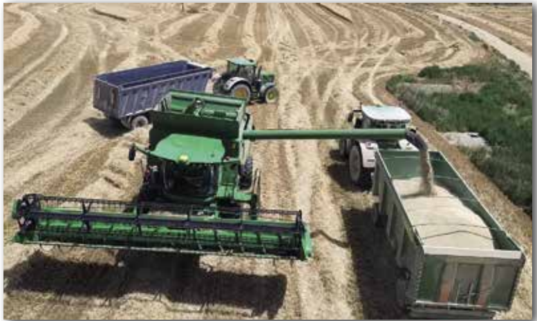
“Cosechando en la val de Liso”

“La situación agrícola es buena. Se sembraron unos 1800 cahices (superficie) de trigo y 100 de cebada, esperando obtener una cosecha en que equivalga a las 14 y 25 simientes respectivamente. La recolección, que se realiza en muy buenas condiciones, con 55 máquinas atadoras y 13 trilladoras, durará unos 50 días. Los jornales corrientes son de 10 pesetas y la manutención”.